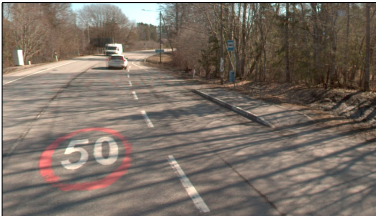
Joonis 1. Riigitee nr 8 km 35,91 olemasolev bussipeatus (tänavavaade aprill 2023)

Olemasolev bussipeatus on tüüp II (avatud taskuga) ning selle on rajatud bussiooteplatvorm ilma ootekojata (vt joonis 1 ).